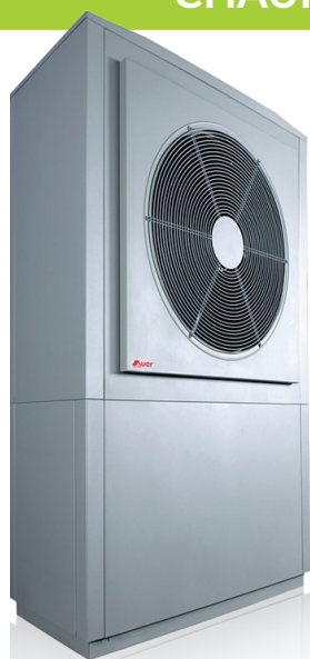
Pompe à chaleur HRC 70 17 à 35 kW

Offre réservée aux particuliers dans la limite des stocks disponibles